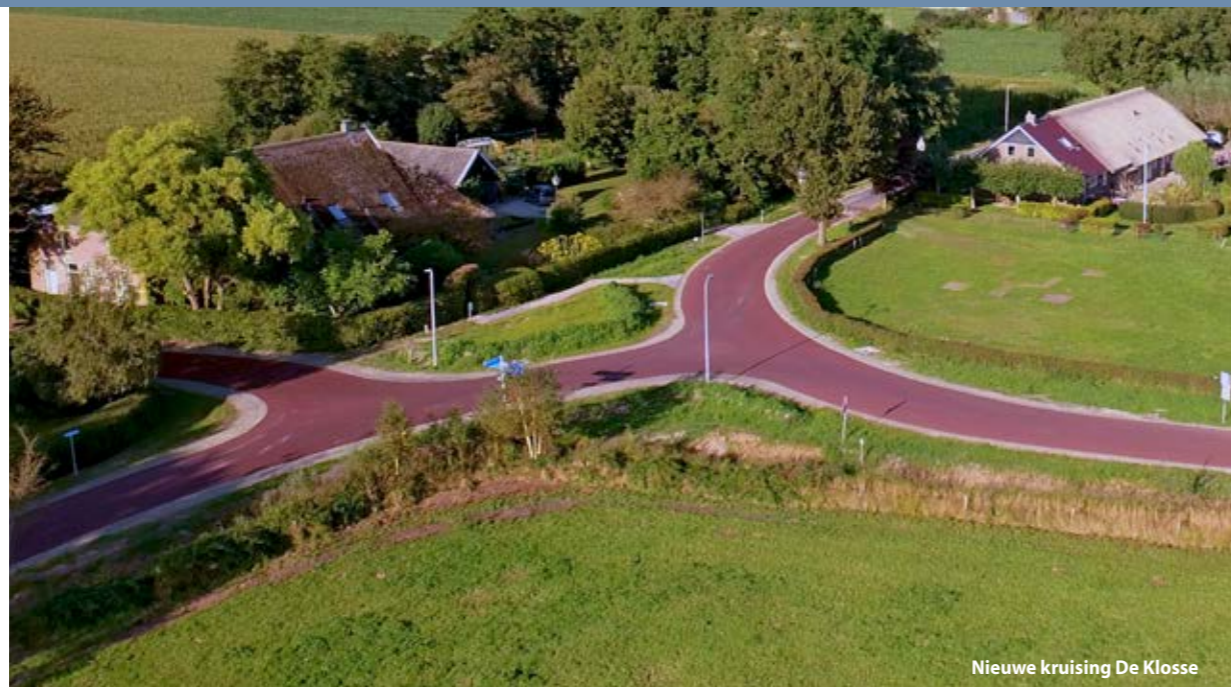
Nieuwe kruising De Klosse