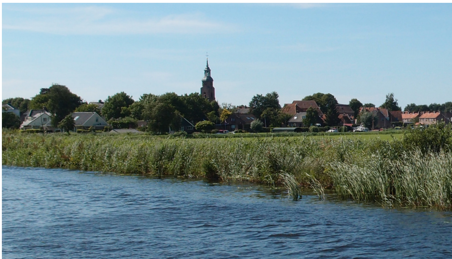
Stadsrand Blokzijl vanaf de noordoostzijde