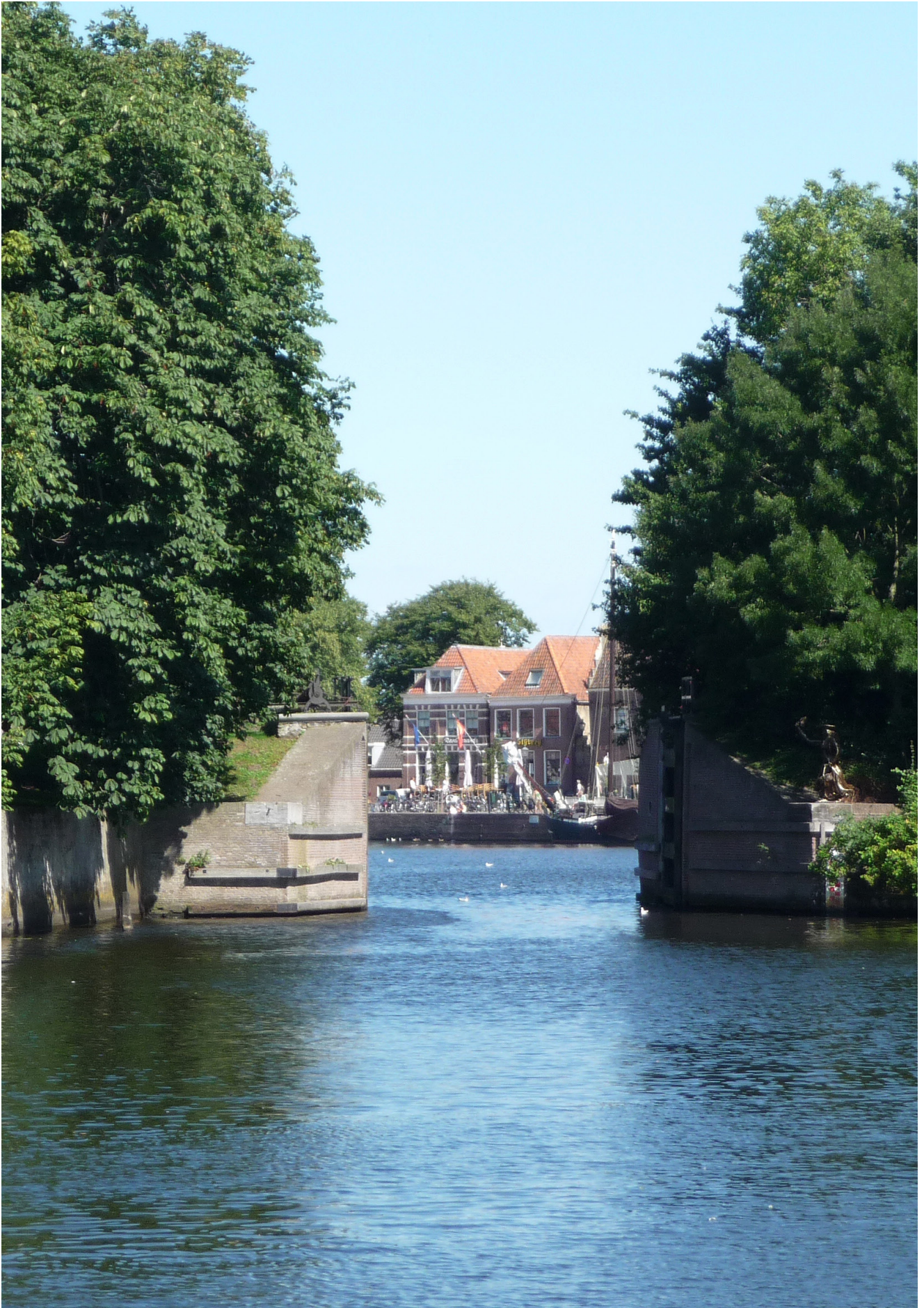
Zicht door de Sas naar de Kolk in Blokzijl