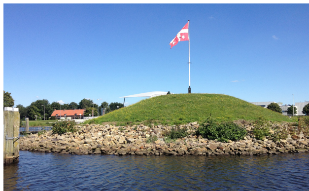
De vlag van Vollenhove bij de entree van de Buitenhaven