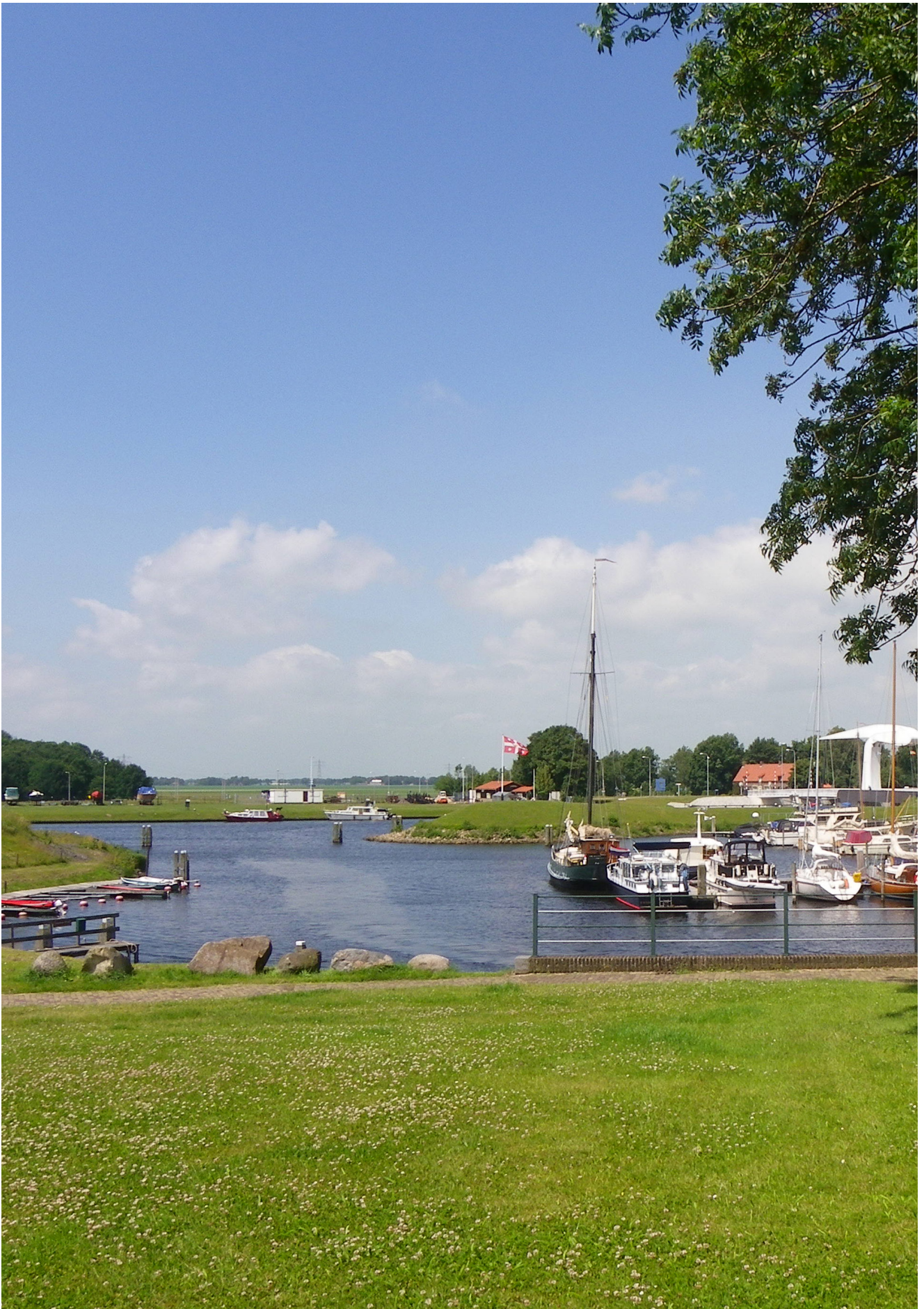
Zicht vanaf de Grote Kerk in Vollenhove richting de Noordoostpolder