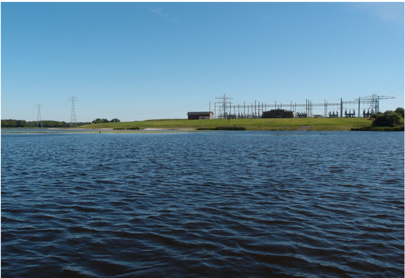
Zuidwestrand Blokzijl (links) en De Voorst vanaf het Vollenhoverkanaal (rechts)