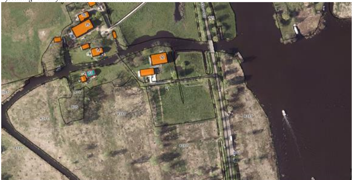
Afbeelding 1: luchtfoto van de bestaande situatie