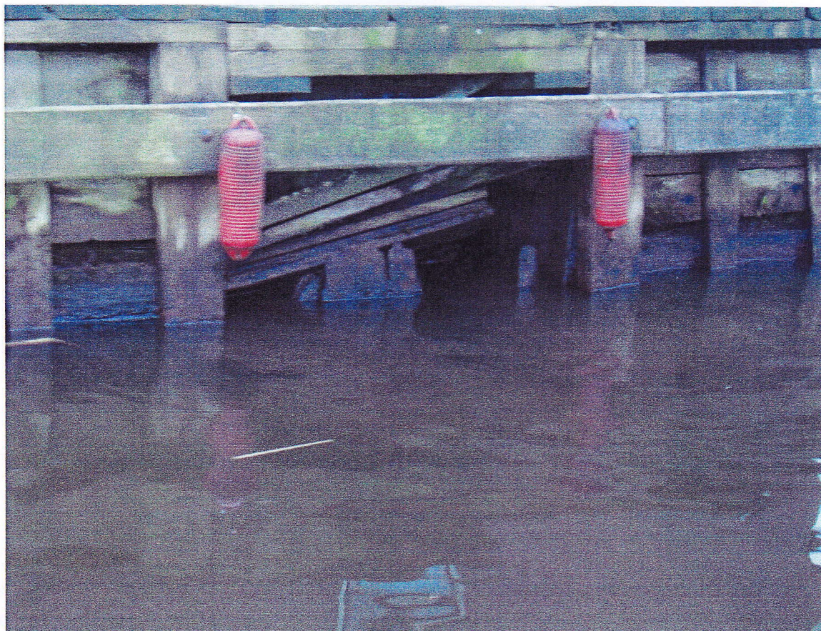
Onderhoud van beschoeiing vereist voortdurende aandacht.

3.5.4 De stichting Dorpsbelangen vraagt de gemeente de mogelijkheden te onderzoeken om een of meer grotere algemene parkeerplaatsen in te richten, conform het ingediende rapport.