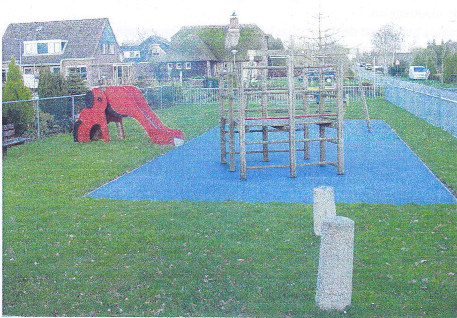
Onderhoud aan de speelplaats vereist voortdurend aandacht.

Een goed leefklimaat is onmisbaar in een dorp dat zichzelf bestaansrecht en een goede toekomst toekent. Het leefklimaat wordt voor het overgrote deel bepaald door de aantrekkelijkheid, de aankleding van een dorp waaraan de laatste jaren veel is gedaan, de aanwezigheid van verenigingen en hun activiteiten, de mogelijkheden voor de jeugd en de saamhorigheid. Voor activiteiten en projecten met name het leefklimaat betreffende heeft de gemeente "Koppengeld" ter beschikking gesteld. Ideeën en suggesties van de bevolking worden door het bestuur van de stichting Dorpsbelangen geëvalueerd, vervolgens met de gemeente doorgesproken, die daarna de uitvoering verzorgt en de kosten in mindering brengt op het budget uit dat koppengeld.