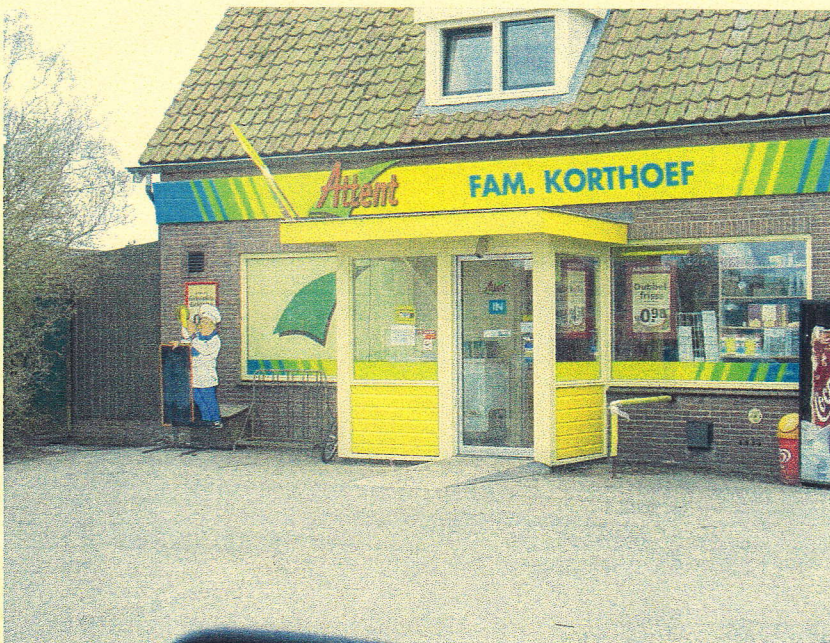
Essentieel voor de leefbaarheid: de buurtsuper.